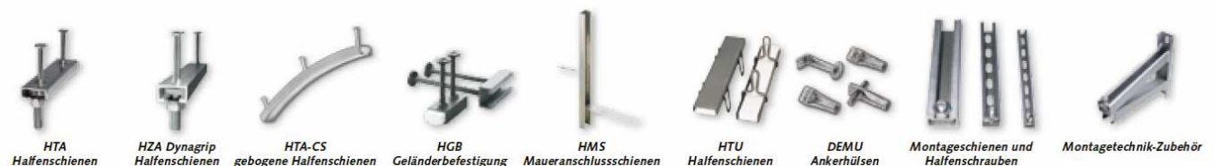
HTA Halfenschiene, HZA Dynagrip Halfenschiene, HTA-CS gebogene Halfenschiene, HGB Geländerbefestigung, HMS Maueranschlussschiene, HTU Halfenschiene, DEMU Ankerhülse, Montageschienen und Halfenschrauben, Montagetechnik-Zubehör