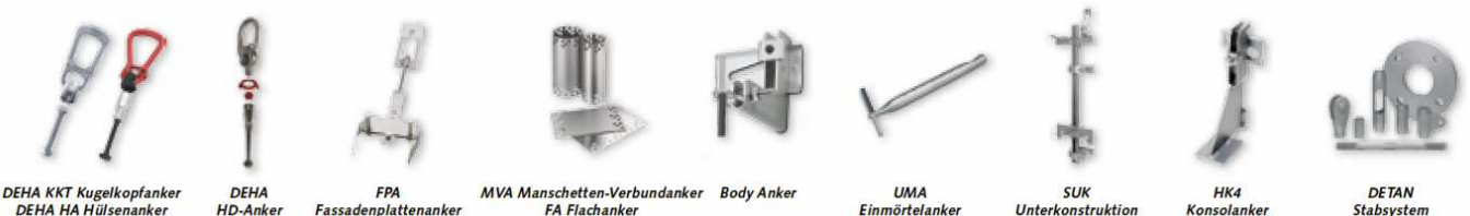
DEHA KKT Kugelkopfanke, DEHA HA Hülsenanker, DEHA HD-Anker, FPA Fassadenplattenanker, MVA Manschetten-Verbundanker, FA Flachanker, Body Anker, UMA Einmörtelanker, SUK Unterkonstruktion, HK4 Konsolanker, DETAN Stabsystem